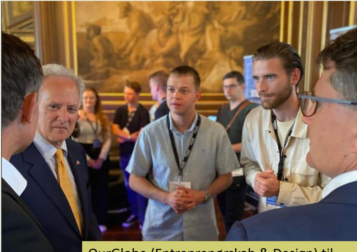
OurGlobe (Entreprenørskab & Design) til finalen på Børsen i juni 2023 - udvalgt til møde med den amerikanske ambassadør