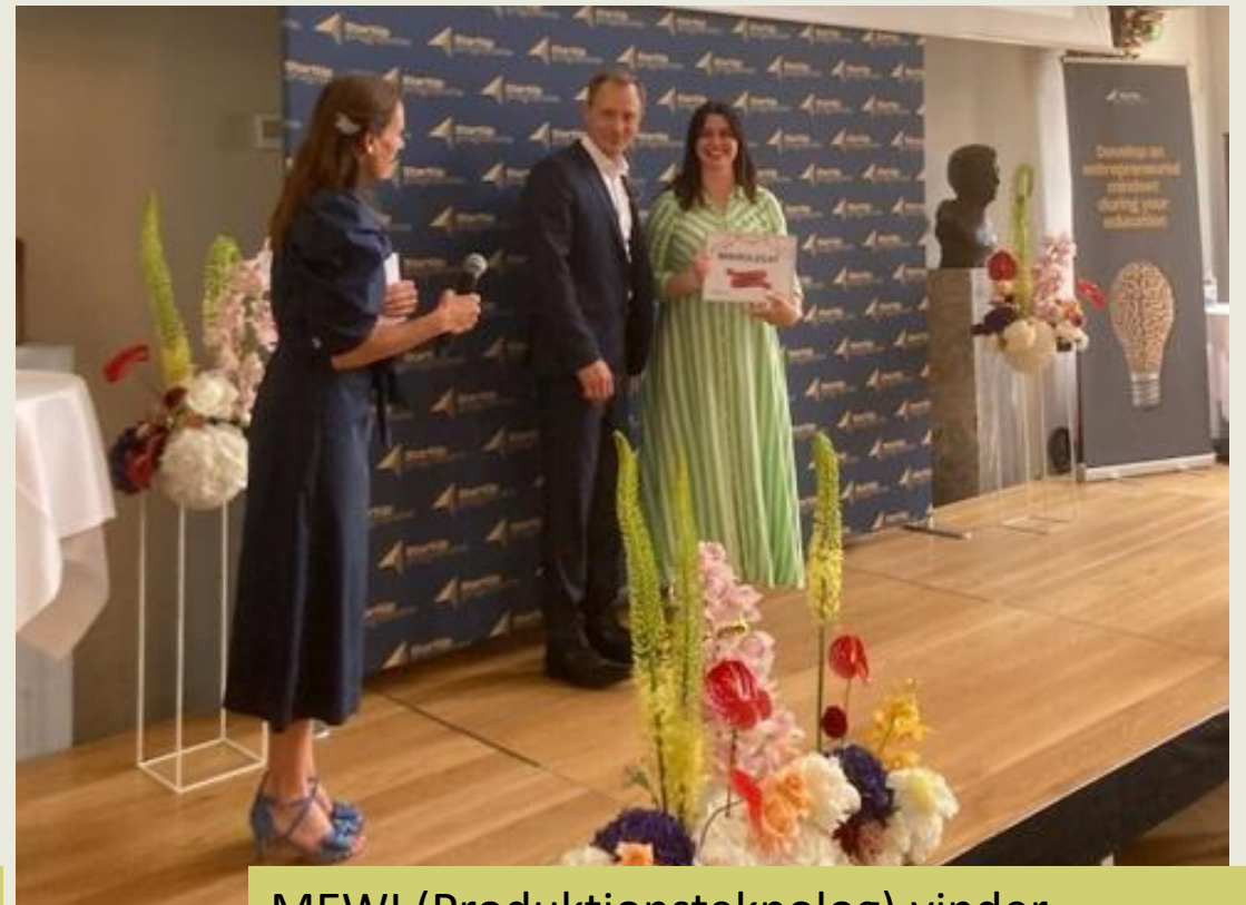
MEWI (Produktionsteknolog) vinder Mikrolegat PÅ 50.000 KR. til DM i juni 2024 - Vandt Grow Up kategorien til de Regionale Mesterskaber